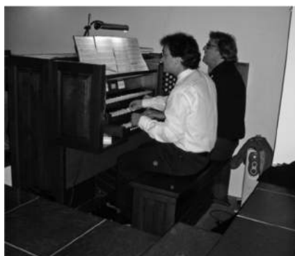
Orgelkonzert September 2006