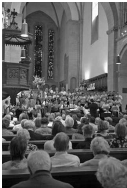
Vernissage Neue Zürcher Bibel Juni 2007 Grossmünster Zürich