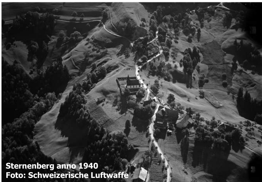
Sternenberg anno 1940