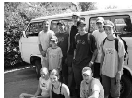
Jugendgruppe Sternenberg 2005

Es war eine strenge, aber schöne Zeit. Auch durfte ich einige interessante und bedeutende Persönlichkeiten kennenlernen, die ich ohne das Amt nicht kennengelernt hätte. Aber das wichtigste war, dass wir ein gutes Team waren in der Kirchenpflege. Wir waren gerade mit einer grösseren Pfarrhaussanierung fertig, da mussten wir schon bald an unser 300-jähriges Kirchenfest denken. Da sollte unser Kirchlein festlich da stehen. Also mussten wir mit der Planung der Kirchensanierung anfangen. Im zweiten Anlauf klappte es dann doch noch und für die Finanzen kam die damalige Kirchenrätin aus Zürich auf den Sternenberg. Sie hat uns sehr kompetent und liebevoll beraten und grosszügig unterstützt. Von Juni bis November 2005 war unsere Kirche geschlossen, wir mussten unsere Gottesdienste im Feuerwehrlokal abhalten. Wer das Lokal kennt, weiss, was wir zu leiden hatten. Trotzdem vielen Dank, wir durften das Lokal gratis benutzen. Auch gingen mein Mann und ich nach Amsterdam, um uns die neue Johannes Orgel anzuhören und vor Ort anzuschauen, natürlich auf eigene Kosten. Am 27.11.2005 war es soweit, wir konnten die frisch renovierte Kirche einweihen; unter Mitwirkung des gemischten Chors Lipperschwendi mitsamt der digitalen neuen Orgel. Unsere alte pneumatische Orgel versah ihren Dienst sehr unregelmässig. Die Organisten mussten immer ein grosses Repertoire an Liedern mitbringen und das spielen, was dann bei der Orgel noch funktionierte. Wenn wir eine Organisten-Vertretung brauchten,