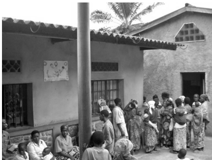
Gesundheitszentrum in Mutumba

Kollekte und Erlös des Essens gehen an die Schönstätter Marienschwestern in Burundi