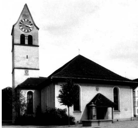
AZB 8494 Bauma