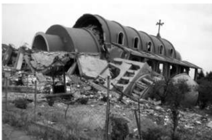
Zerstörte Kirche in Syrien

Herzlich laden ein: Reformierte und Katholische Kirchengemeinden Bauma-Sternenberg