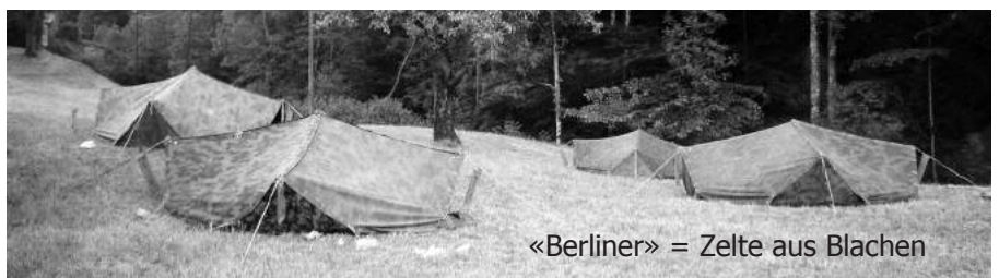
«Berliner» = Zelte aus Blachen