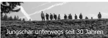
Jungschar unterwegs seit 30 Jahren

Freier Eintritt, Kollekte zur Deckung der Unkosten und zugunsten eines Hilfsprojekts.