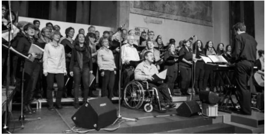
Der Gospelchor Pfäffikon mit «OMG – Oh My God»