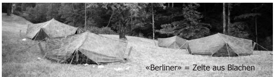
«Berliner» = Zelte aus Blachen