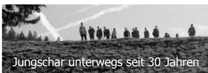
Jungschar unterwegs seit 30 Jahren

Freier Eintritt, Kollekte zur Deckung der Unkosten und zugunsten eines Hilfsprojekts.