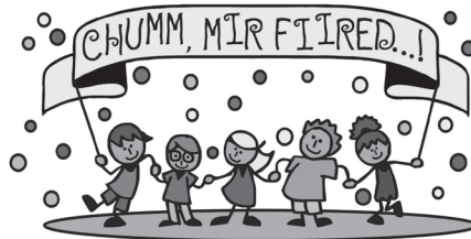
Feste im Kirchenjahr