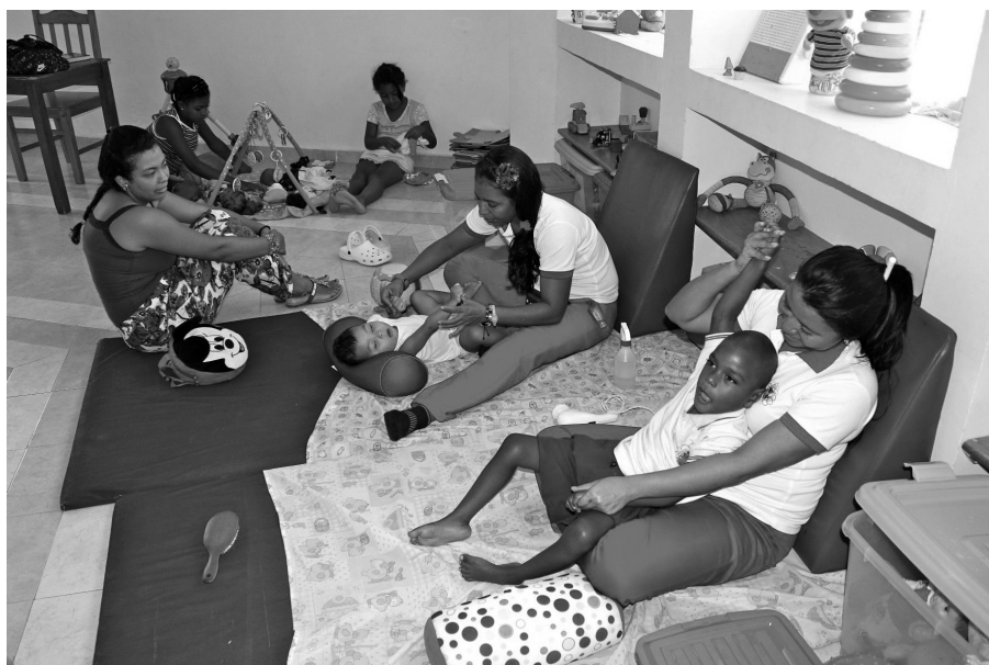
Arbeit mit behinderten Kindern