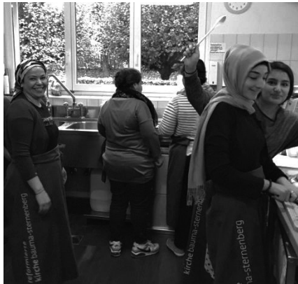
Hier wird fleissig der Kochlöffel geschwungen...

Am 28. Oktober 2018 fand der letzte Chile-Zmittag in diesem Jahr statt. Die Flüchtlingsfamilien, die sich jeweils am Montagnachmittag im Kirchgemeindehaus treffen, kochten Spezialitäten aus ihren Herkunftsländern. Die Leute kamen in Scharen und liessen sich die feinen Speisen schmecken. Die Köchinnen freuten sich über die zufriedenen Gäste und schätzten den Kontakt mit neuen Leuten.