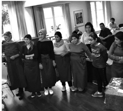
Alle fleissigen Frauen in einer Reihe – herzlichen Dank für das feine Mittagessen!

Text: Marianne Schoch