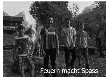
Feuern macht Spass