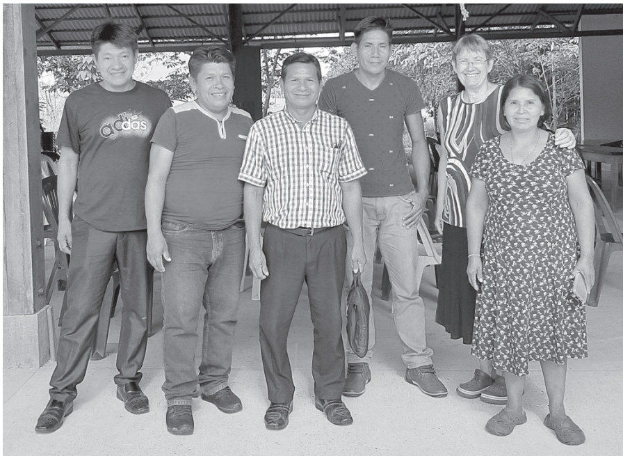
Indigene Leiter, die lernen wollen, wie man besser unterrichtet.