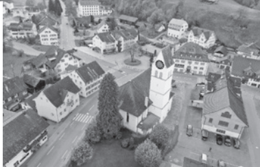
reformierte kirche bauma-sternenberg

Wir freuen uns auf eine kommunikative Persönlichkeit, die: