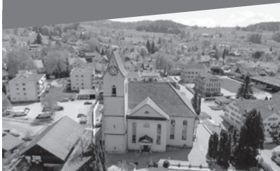
reformierte kirche bäretswil