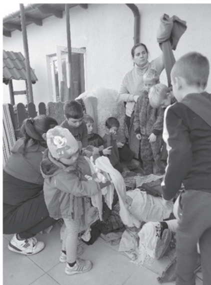
Ankunft von Kleidern für Kinder