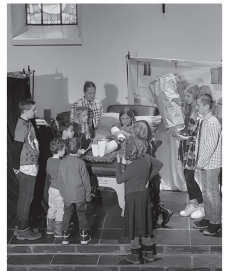
13 Kinder führten in Sternenberg am Morgen des 3. Advent das tradi- tionelle Kolibri-Weihnachtsspiel auf.