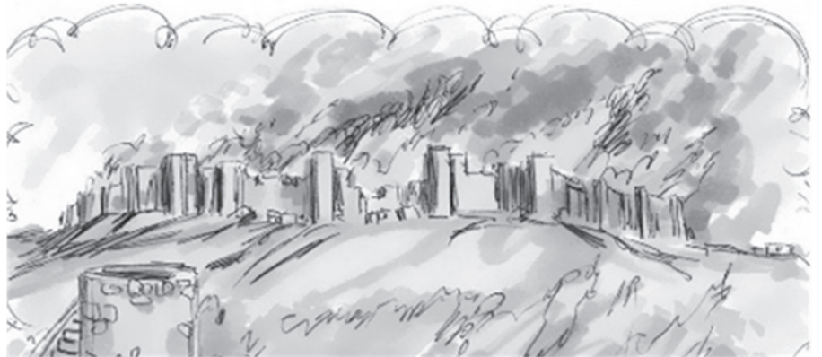
Die zerstörten Stadtmauern von Jerusalem.