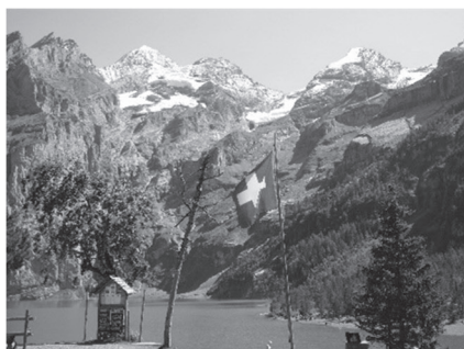
Schweizer Fahne am Oeschinensee, Berner Oberland

«Soldaten! – Ihr müsst aus diesem Kampfe nicht nur siegreich, son-