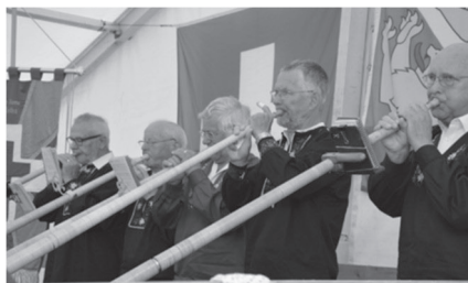
Alphornklänge beim Betttagsgottesdienst auf dem Nollen, Thurgau

Bundesstaates im Jahre 1848, kurz nach dem Sonderbundkrieg. Es sollte ein Tag sein, der in der politisch und konfessionell gespaltenen Schweiz von den Angehörigen aller Parteilagen und Konfessionen gefeiert werden kann. So sollte damit auch der Respekt vor dem politisch und konfessionell Andersdenkenden gefördert werden.