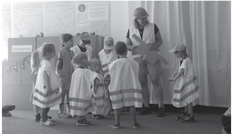
Mauerbau während des Morgenprogramms

Verschiedene Angebote am Abend luden zu unterschiedlichsten Gemeinschaften ein: so erinnerten uns Vertreter der Organisation Open