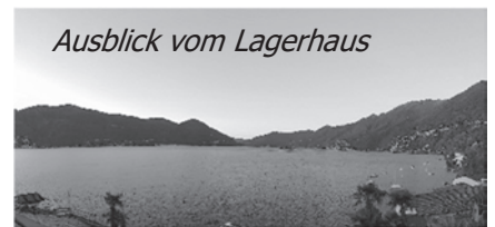
Ausblick vom Lagerhaus