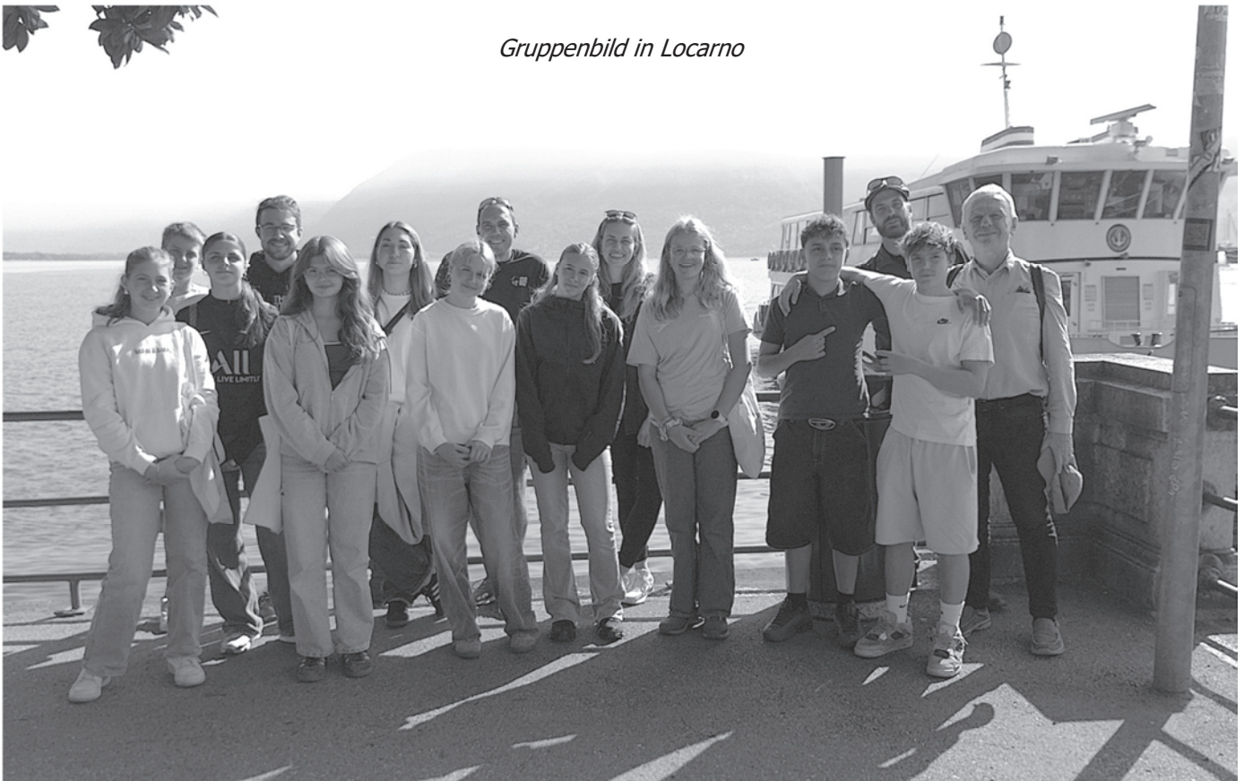
Gruppenbild in Locarno