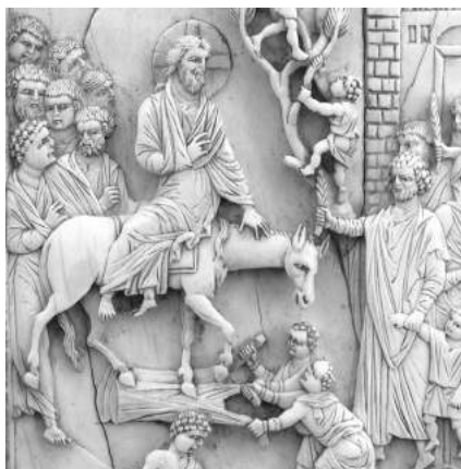
Elfenbeinrelief, Konstantinopel, 10. Jahrhundert

Am Palmsonntag erinnert man sich an den triumphalen Einzug von Jesus in Jerusalem. Da wurden Palmzweige geschwungen, Kleider und Tücher vor Jesus auf den Weg gelegt und Jubelrufe skandiert. Es wird berichtet, dass die ganze Stadt erregt war. Jesus wurde von seinen Anhängern begeistert gefeiert. Es war die Begeisterung derer, die miterlebt oder erzählt bekommen hatten, dass er Kranke geheilt und Kinder gesegnet hatte, dass er Frauen ihre Würde geschenkt und Sündern die Vergebung von Gott zugesprochen hatte. Es war die Begeisterung der Gläubigen, die in ihm den von Gott versprochenen Messias erkannten und ihm deshalb Hosianna zuriefen. Damit gingen weitere Worte der Prophetie in Erfüllung: «Sieh, dein König kommt zu dir, gerecht und siegreich ist er,