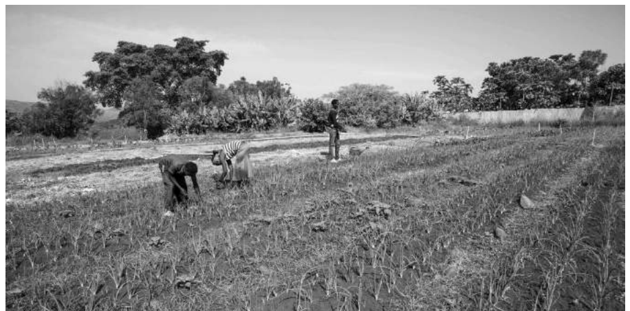
Das Gemüsefeld wird als Schulungsort gebraucht und liefert auch das Gemüse für die Mitarbeitermensa

Die Kollekte des ökumenischen Gottesdienstes und der Erlös des Zmittags werden vollumfänglich der Mission am Nil gespendet.