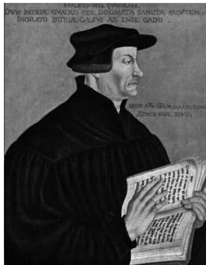
Huldreich Zwingli (1484 – 1531) Zürcher Reformator

Das Evangelium von Jesus Christus befreit den Menschen von aller Verseuchung durch Religion, denn der religiöse Mensch versteht sich heimlich immer als etwas Besseres. Christus aber sucht weder Fromme noch Gute. Er macht Sünder und Gottlose gerecht. Damit befreit Gott Mensch und Kirche von jeder scheinmoralischen Vereinnahmung.