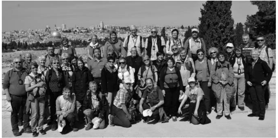
Auf dem Ölberg bei Jerusalem

Entlang dem Jordantal ging die Reise weiter südwärts bis nach Jericho. Wir besuchten einen Kibbutz mit einem Bio-Landwirtschaftsbetrieb sowie die Stelle, wo Jesus im Jordan getauft worden war. Der nächste Tag bot ein aktives Programm. Zunächst schwebten wir mit der «Von Roll»-Seilbahn zur Felsenfestung Massada und genossen einen tollen Ausblick in die Wüste und zum Toten Meer. Am Mittag teilte sich