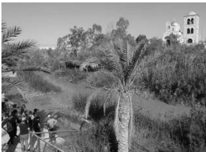
Taufstelle von Jesus im Jordan

Die drei Kirchgemeinden Bauma-Sternenberg, Fischenthal und Bäretswil führten vom 8. bis 18. März 2018 eine Reise nach Israel durch. Die 39-köpfige Reisegruppe, mit Teilnehmenden aus allen drei Kirchgemeinden, startete ihr Abenteuer mit einem ruhigen und sicheren ELAL-Flug nach Tel Aviv. Zunächst ging es der Mittelmeerküste entlang nordwärts, wir besuchten die römische Hafenstadt Cäsarea Maritima und die Stadt Akko. Bei unserem guten und sicheren Carchauffeur und seiner Beduinenfamilie kosteten wir zum ersten Mal das Gericht Falafel. Nach der Weiterreise durch Galiläa erreichten wir gegen Abend das Hotel direkt am Ufer des Sees Genezareth. In dieser herrlichen und im Frühjahr grünen Gegend rund um den See Genezareth, hielten wir uns zwei Tage auf. Wir besuchten u.a. den Mount Arbel, den Berg der Seligpreisungen, das historische Kapernaum, die Jordanquelle und wir unternahmen eine Bootsfahrt auf dem See Genezareth, fuhren entlang der libanesischen Grenze und warfen von ehemaligen israelischen Befestigungsanlagen auf den Golanhöhen einen Blick nach Syrien.