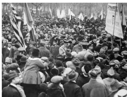
Paris, 11.11.1918: Die Menschen feiern das Ende des 1. Weltkrieges

brüchiger Friede. Eigentlich war es – wie sich bald herausstellte – nur ein langer Waffenstillstand, der in einen noch schlimmeren Krieg mündete! Nicht einmal der mutigste menschliche Optimismus konnte die neu aufbrechenden Urgewalten der Zerstörung aufhalten.