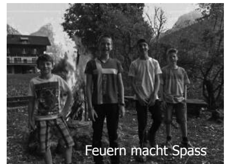
Feuern macht Spass