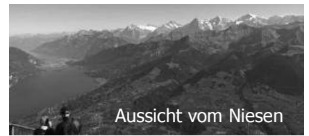
Aussicht vom Niesen