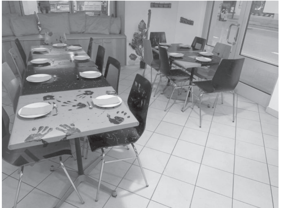
Langsam kehrt wieder Leben in unsere Werchstatt. Vorbereitungen für den Besuch der Ameisli während dem Auffahrtslager «UfLa» im Mai 2021.