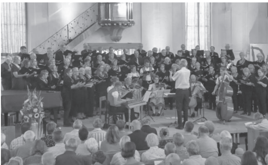
Singkreis-Konzert vom 15. September 2019 mit Brandhölzler Strichmusik und Solojodlern in Bäretswil